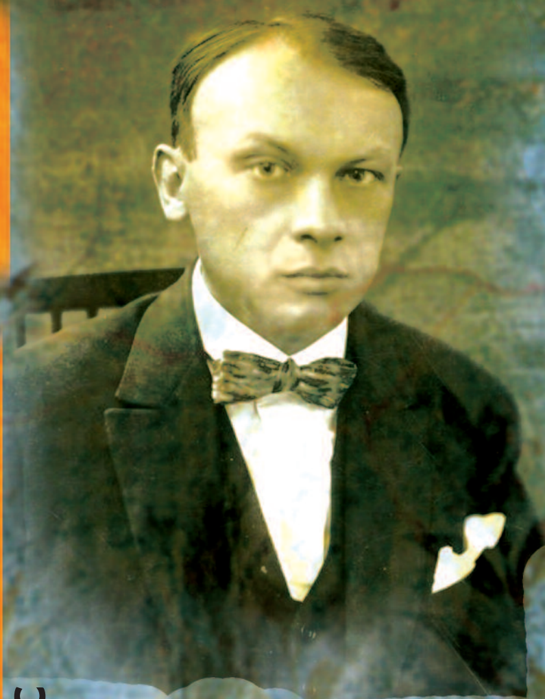
Jan Parandowski (1895–1978)